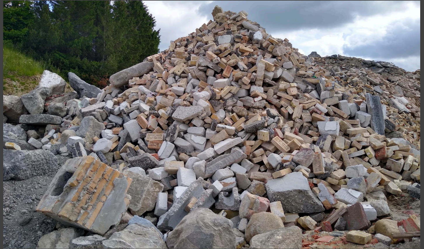
Genbrugsprodukter (tegn og beton)